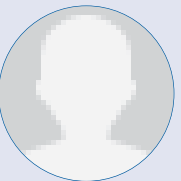
RÉSEAU DES RETRAITÉS (désignation en cours)