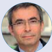
RELATIONS AVEC L'AP-HP Pascal DE WILDE