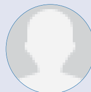
RELATIONS AVEC LA CNDGCHU