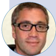
Vincent PRÉVOTEAU Évolution des territoires, des organisations hospitalières et de la gouvernance